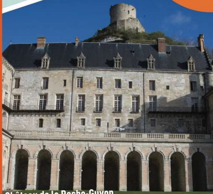
Château de la Roche-Guyon